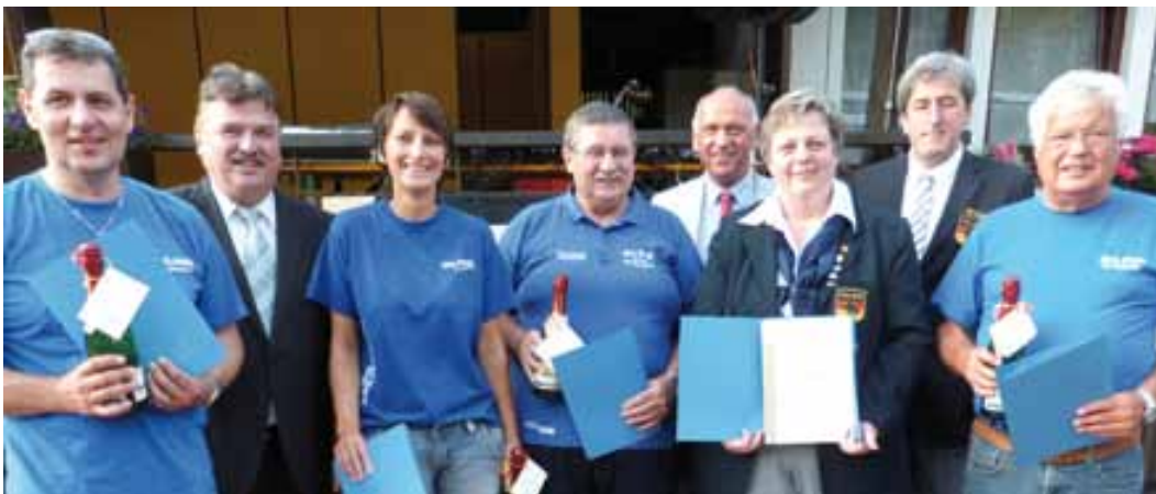
Das Wirsberger Leitungsteam in Feierlaune