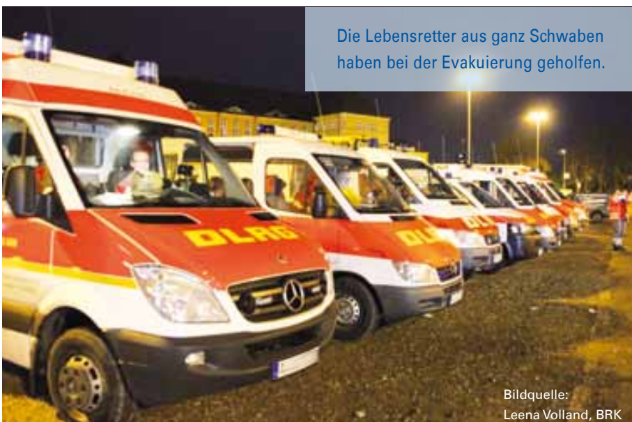
Die Lebensretter aus ganz Schwaben haben bei der Evakuierung geholfen.

Ursprünglich sollte die Evakuierung um zehn Uhr abgeschlossen sein und mit den Kontrollen begonnen werden. >>